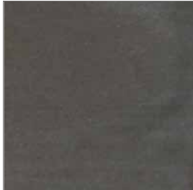
GRIS FONCÉ - (Dark Gray)