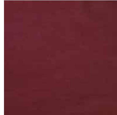
VINO - (Burgundy)