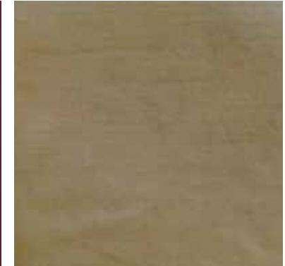
KAKI - (Kakhi)