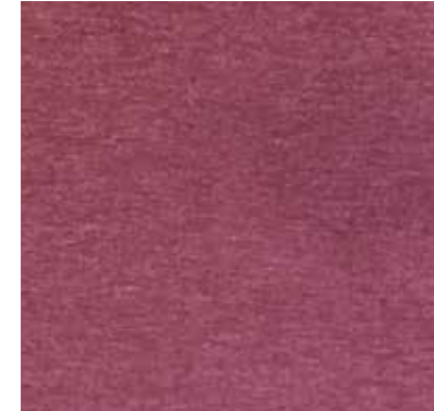
VINO - (Burgundy)*