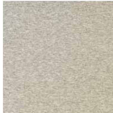
SPORT GRIS MIX - (Gray Mix Sport)